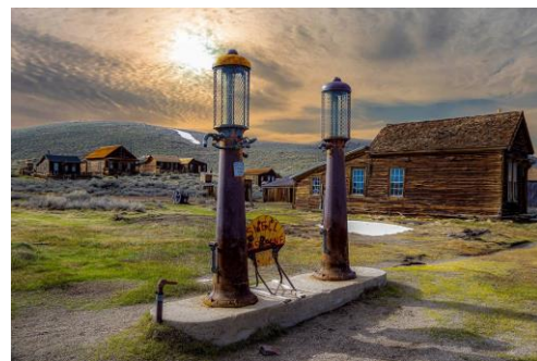
Ville fantôme en Californie

À titre d'exemple, des villes étatsuniennes comme Rhyolite dans le Nevada ou Calico en Californie sont apparues lors de la ruée vers l'or (1870-1880) et ont été désertées jusqu'à devenir des villes fantômes dans les années 1950, lors de la période de la crise de l'or. Sur le plan géopolitique, la deuxième guerre mondiale et notamment l'occupation d'une partie de la France a contraint les populations françaises à des migrations interurbaines importantes.