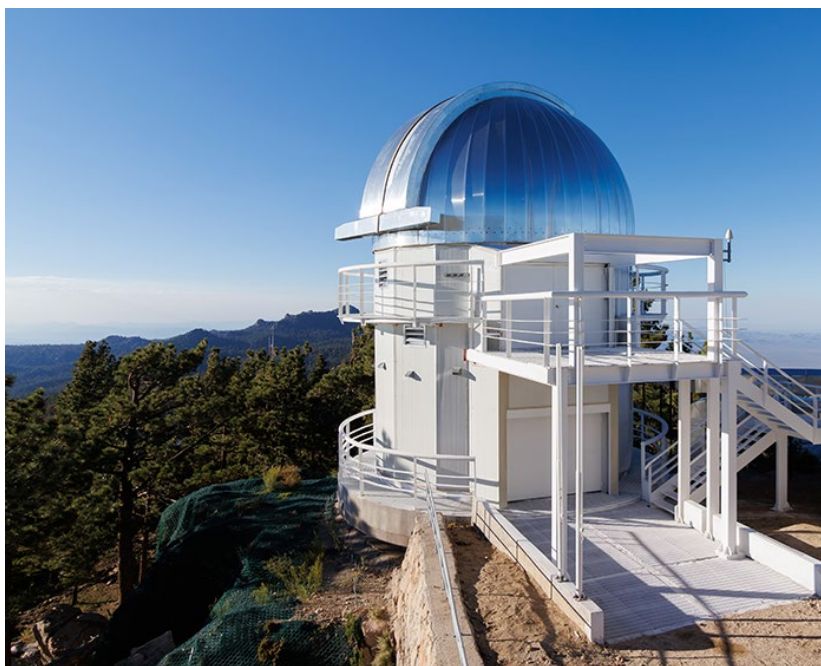
Coupole du télescope terrestre COLIBRI installé à l'Observatoire astronomique national de San Pedro Mártir au Mexique, Basse Californie. Situé à environ 2800 m d'altitude, le site bénéficie de conditions d'observations exceptionnelles qui le classe parmi les meilleurs au monde.

Pour en savoir plus sur la mission SVOM, accédez au communiqué de presse dédié : https://www.cnrs.fr/fr/presse/la-mission-svom-destinee-letude-des-plus-lointaines-explosions-detoiles-ete-lancee-avec